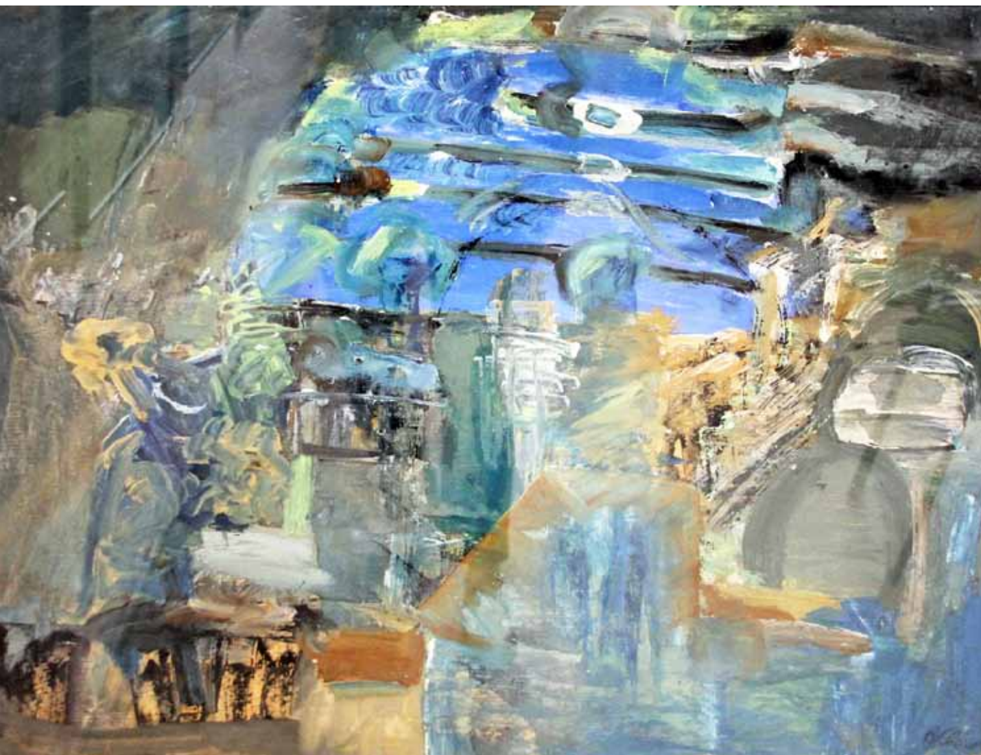
Владимир Квасов. Просвет . 1992. Картон, гуашь. 66x82

У Квасова — собственный, неповторимый стиль. Условность и обобщенность его произведений переплетаются с реальностью, наивная искренность, открытость восприятия — с глубоким философским осмыслением. На задниках картин, сокрытых от взора зрителя, читаем: «Жить музыкой нельзя. Жить надо в музыке», «И только в муках свет приходит», «Только распахнутая душа угодна Богу», «Бог отдает любому то, что любо», «Не надо утруждать себя памятью, нужное всегда рядом», «Боже, не дай мне возможности потерять самого себя», «Знать не надо ничего — все уже