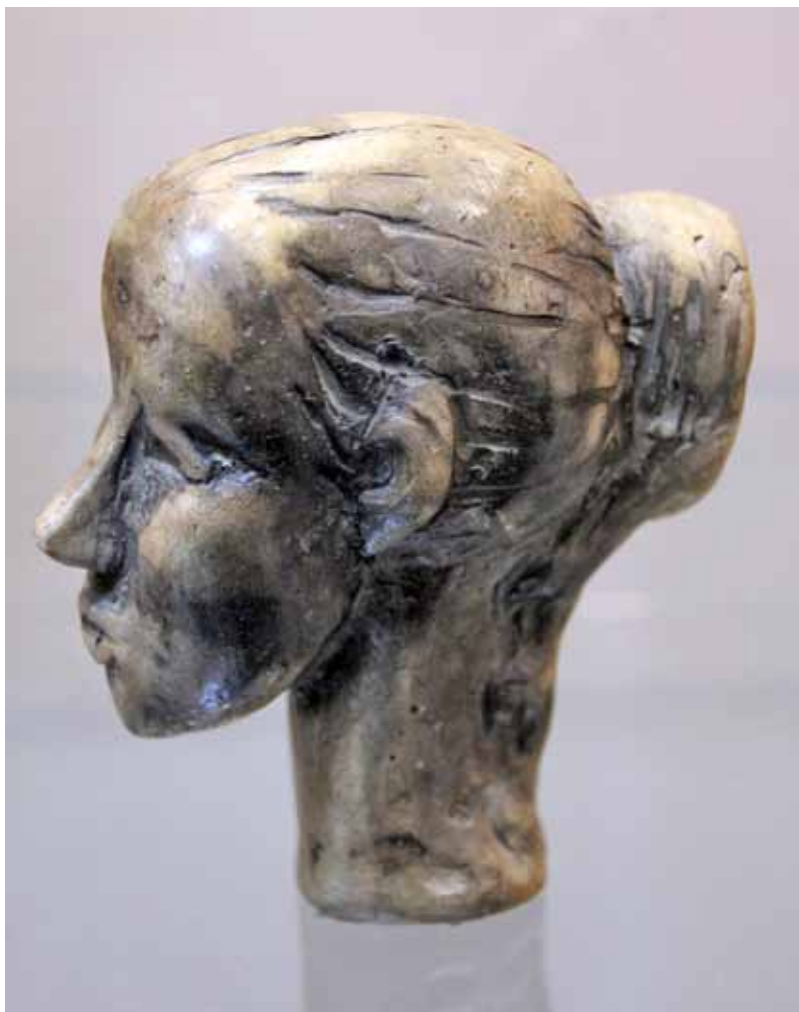
Владимир Квасов. Неизвестная . 1980-е. Глина